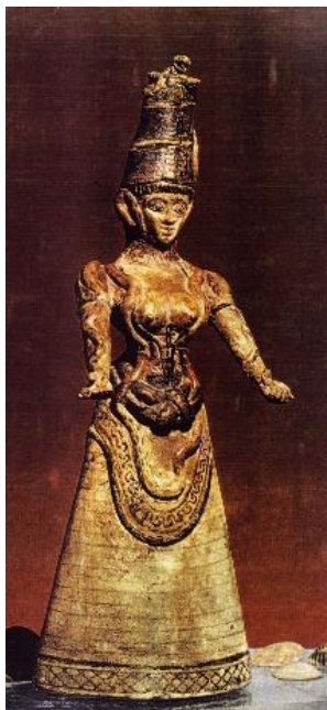
Fig. 1 – Deusa das serpentes – Deusa do nó.

desse barrado, o corpo de uma enorme serpente que, partindo do topo da coroa em forma de tubo, desce num movimento sinuoso, contornando a lateral da cabeça, 4 os ombros, a linha dos seios, a cintura e o ventre, para retornar ao alto, sobre a coroa, onde a cabeça do réptil com a boca aberta encontra a cauda. Sob o corpo da serpente, na região do cinto pubiano, tem-se a presença do nó, ou laço, sagrado. Os seios nus são realçados por um corpete.