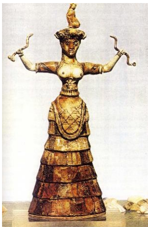
Fig. 2 – Deusa das serpentes – Deusa com felino.